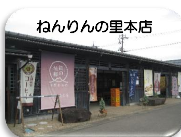
ねんりんの里本店