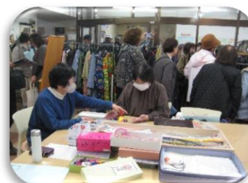
和洋服リフォーム 手作り品の販売