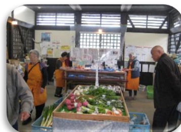
新鮮野菜の直売所