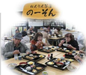
美味しかったあ♪ のーそん御前